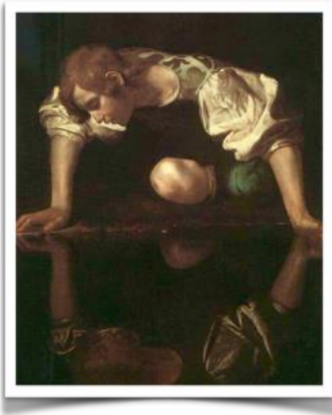
Narciso, olio su tela, Attribuito a Caravaggio, 1597/99 Palazzo Barberini, Roma

Il tuo occhio destro e' uguale al sinistro... Il tuo orecchio destro e' uguale al sinistro... Il tuo piede destro e' uguale al sinistro... due forme si ripetono come allo specchio , lungo una linea immaginaria che le divide a metà: sei di fronte alla SIMMETRIA!